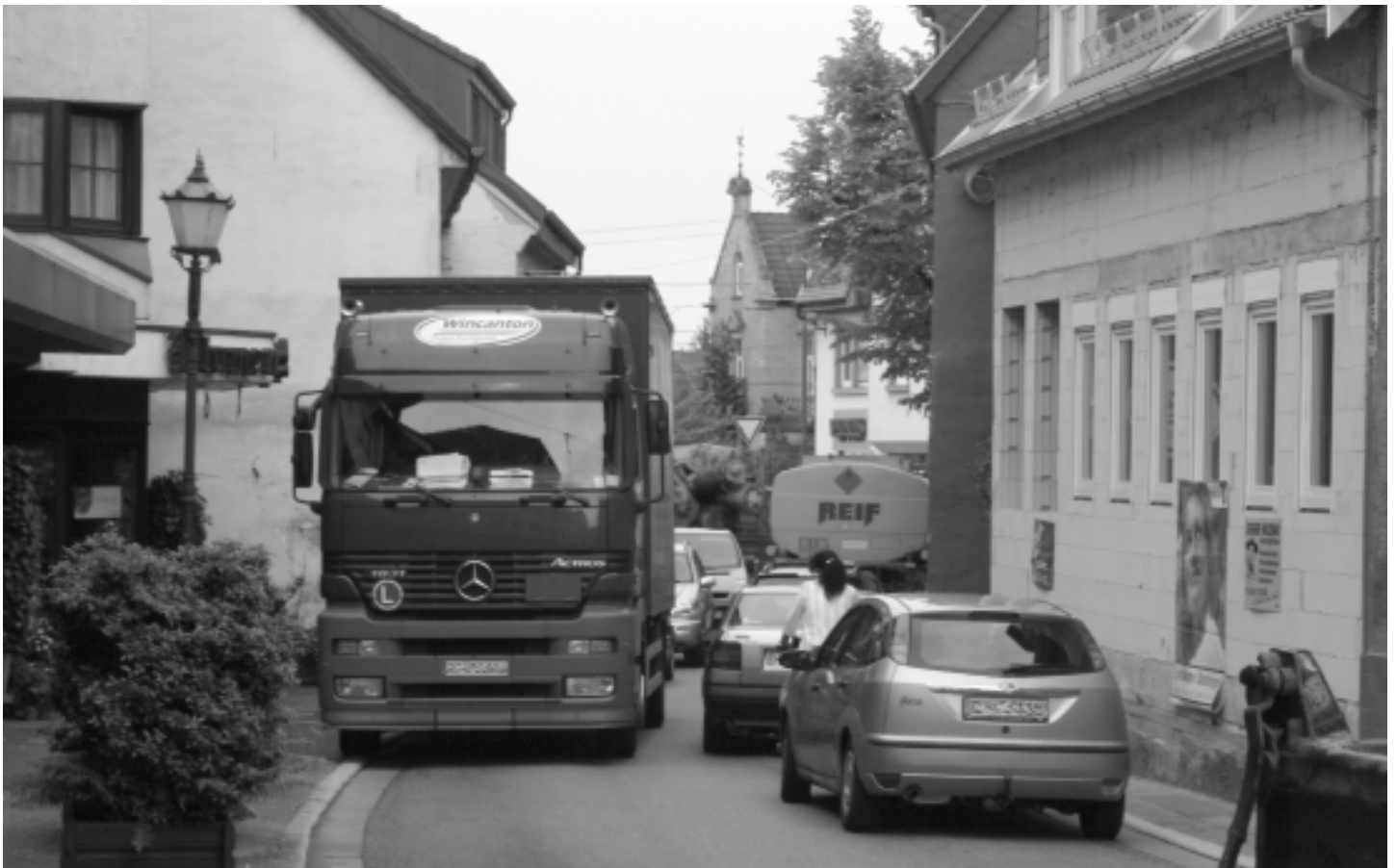
Das alltägliche Verkehrschaos in der Rathausstraße

Gutachten geht von massiven Überschreitungen der Grenzwerte aus