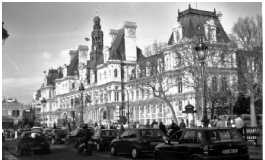
Hotel de Ville/Paris (Rathaus)

Leider ist diesem Vorschlag bis heute niemand gefolgt.