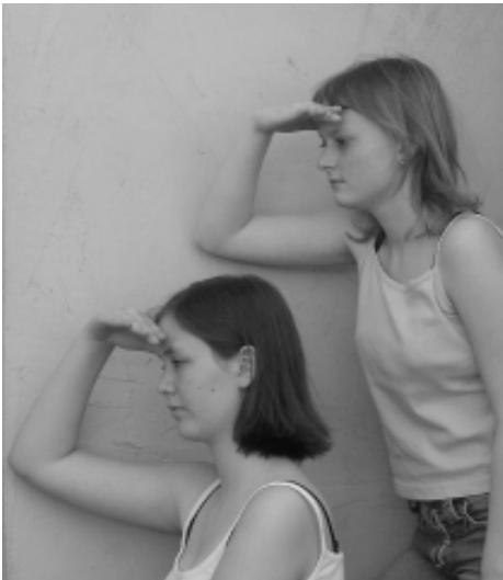
Auf der Suche nach Bildung

„Im Kinnagadde wäd ee nur de ganze Daag Kaffee gedrung-ge, un die Kinna schbiele hald ebiss!“ Auch wenn solche Äußerungen in unserem geheiligten Gemeinderatsgremium schon gefallen sind, und sich die Wertschätzung der Kindergartenarbeit auf Worte beschränkt, seit Pisa ist der Blick auf eine frühkindliche Förderung, also auch schon im Kindergarten, schärfer geworden. Die Erkenntnis, dass möglichst alle Kinder eine wertvolle Lern- und Reifezeit im Kindergarten durchlaufen sollten, hat sich nicht nur allgemein in unserer Gesellschaft herumgesprochen, nein, dieser Lehrsatz ist auch schon auf der Insel Leimen angekommen und wird inzwischen so auch im Gemeinderat zu hören sein, quer durch alle Farben.