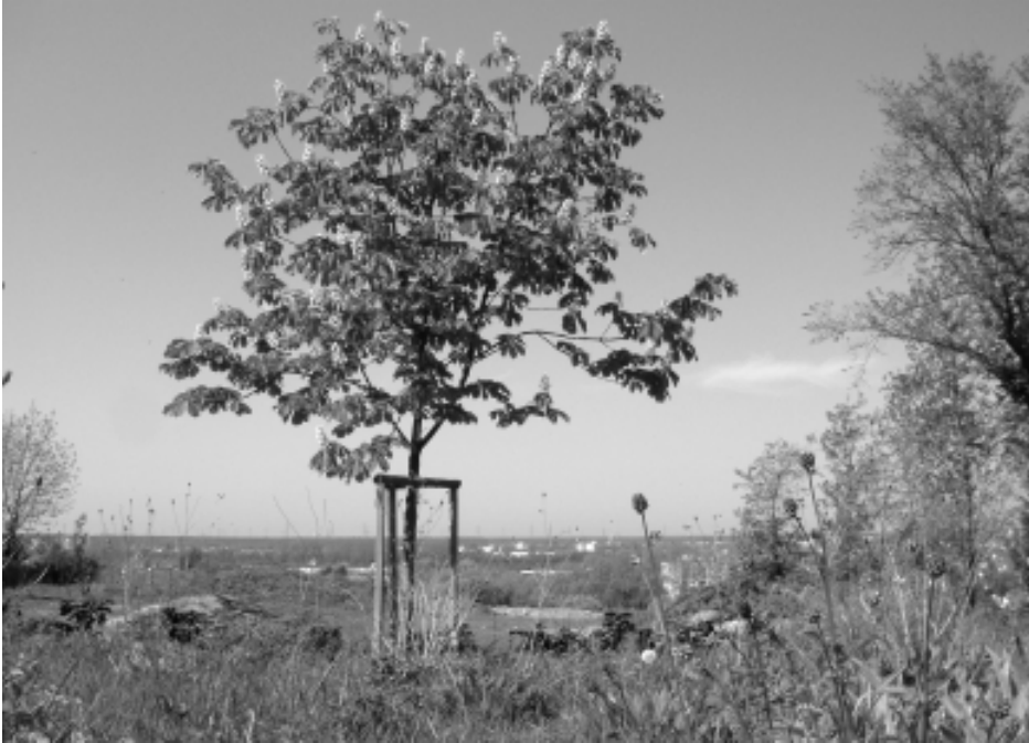
Blühende Roskastanie auf dem Friedhof in Leimen

Wer jetzt im Spätfrühling oder Frühsommer durch Leimen geht, könnte denken, dass die Tafel für Nektarsammler reich gedeckt ist. Doch mit den Augen einer Biene gesehen, sieht es eher mager und unzureichend aus.